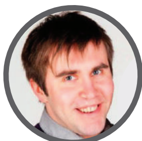
Jaak Ajavõtt & Tulemused 515 3557