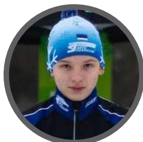
Mihkel Keskuse ehitus 5650 6698