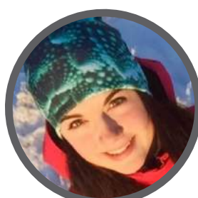
Hanna Britt Kurgi Kuuno lastesõidud 524 5426