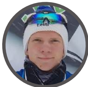
Jarmo Keskuse ehitus 5194 3553