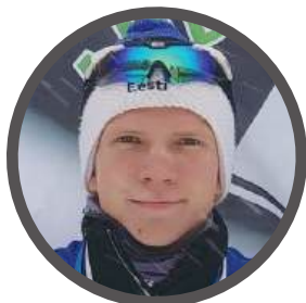
Jarmo Keskuse ehitus 5194 3553