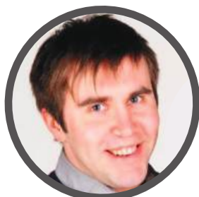
Jaak Ajavõtt & Tulemused 515 3557