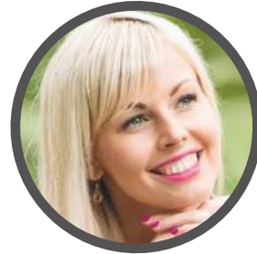
Eike Laste suusatund 53889360